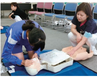
BLS(一次救命処置)講習に参加

事がとても美味しかったです。職員の方がたくさん話しかけてくださいました。様々な部署の方が集まって話をされていて、すごく良い雰囲気だなあと感じました。」と感想をいただきました。将来は医療人になりたいという明確な目的意識を持って取り組まれている姿に、私たちは感銘を覚えました。皆さまのあたたかいご協力に感謝いたします。