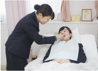
双方の体験で多くの発見に感動

公益財団法人 日本医療機能評価機構認定病院 公益社団法人 日本人間ドック学会 人間ドック健診施設機能評価認定施設 〒719-3193 岡山県真庭市西原 63 TEL (0867) 52-1191(代) FAX (0867) 52-1917 http://www.kaneda-hp.com