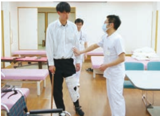
下肢装具を装着して患者さん体験