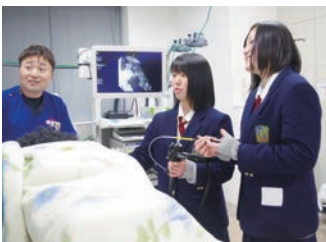
緊張の内視鏡操作

第4回病院見学会 4月7日(土)病院見学会を開催し、医療人を目指す学生と保護者の皆さま等、計13名が参加しました。4グループに分かれ、医療職インターンシップ体験で4ブースを回りました。放射線科は、中身が見えないお菓子が入った筒をレントゲンとCTで撮影し、どのように見えるのか、画像診断の過程を交えながら説明。臨床工学技士のブースでは、手作り人形のお腹に入っているくし引きの紙を内視鏡操作で1枚取り出しました。看護部はソフト食を用いて、食事を摂取する患者さんと食事を介助する看護師双方の体験を行いました。